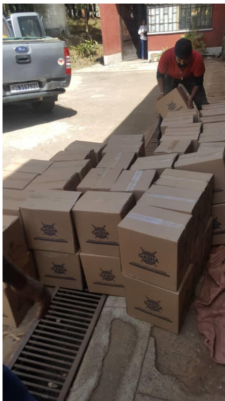
Dozen vol Gasha sanitizer