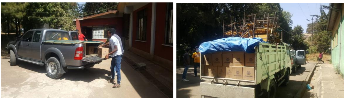
Sebeta-school-for-the-blind: sanitizer met stoelen er bovenop