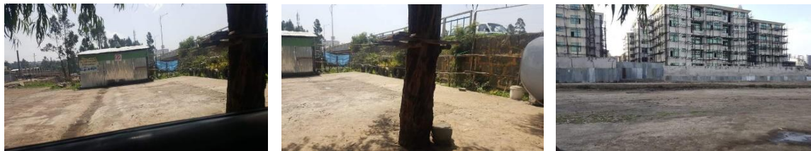
Carwash in de wijk GORO, vlakbij de ring richting Debre Zeit – Addis Abeba