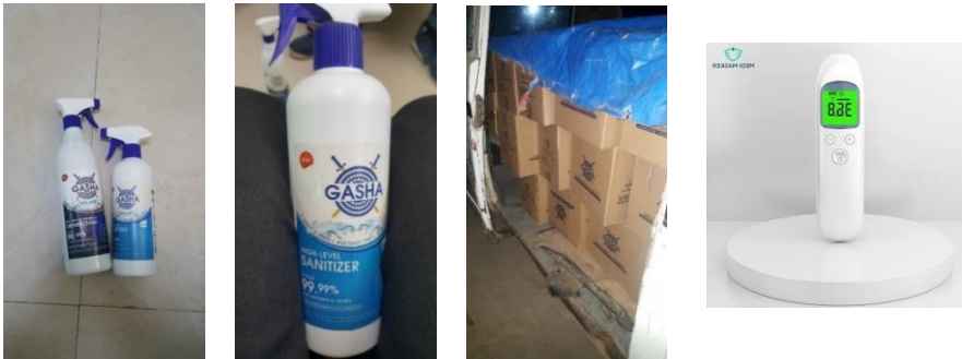
GASHA company sanitizer van Gashashield - Addis Abeba – opslag klaar voor transport

Stichting Berhan heeft ook 2 digitale contactloze thermometers aangeschaft. Voorgaande jaren werden hulpmiddelen altijd meegenomen door vrienden/ kennissen die naar Ethiopië gingen, helaas was dat dit keer geen optie, de thermometers zijn onlangs verstuurd.