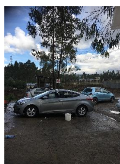
Wijk in aanbouw en start aanleg van de verharde weg deel nieuw beton op de wasplaats

Belangrijk is dat ook zo snel mogelijk een start gemaakt wordt voor het plaatsen van een hek om te voorkomen dat iedereen de autowasplaats oploopt, ook is er dag en nacht iemand aanwezig om te voorkomen dat materialen meegenomen worden. Materiaal, zoals voor de omheining, is duur. Zodra de prijs meevalt, is de kwaliteit vaak slecht. Zo kost het draadwerk voor ong 50 meter en 2 meter hoog ongeveer 50.000 etb, dat is dan excl. de staanders en het werk om het hek te plaatsen. Stap voor stap hopen wij met hulp dit te project te kunnen realiseren, water is er voldoende en als er ook toestemming gegeven wordt voor gebruik electra kunnen we verder werken aan de basisvoorzieningen.