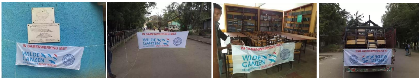
Sebeta school – voorheen gesponsord door de Nederlandse ambassade nieuw schoolmeubilair transport schoolmeubilair