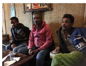
in het midden Wondinet