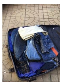
deel van de 500 stuks kleding