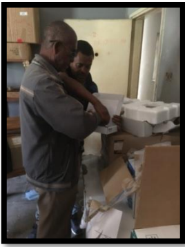
lokaal voor alle nieuwe hulpmiddelen