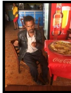
ron en eyasu