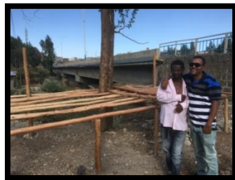
mamuse en yidnekachew, start met de voorbereidingen tbv CARWASH plaats

Ook een echtpaar, beiden met een auditieve beperking, willen graag komen werken als de 'carwash' plaats klaar is. Het plan is om overdag iemand een vaste plek te geven voor het zetten van Ethiopische koffie (ceremonie), thee en het bereiden van de lunch voor bezoekers.