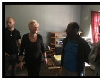
< dozen worden uit de Store gehaald, en het huidige computerlokaal en 2 perkins braille schrijfmachines