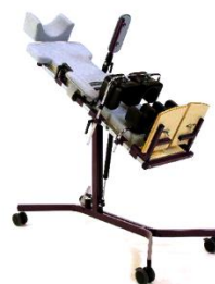
sta-tafel bever ( atlas kidtech)