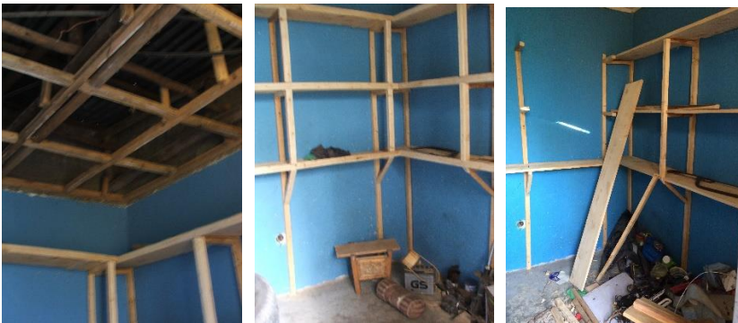
Verbouwing van de winkel

Er is in februari een start gemaakt met de voorbereiding voor het inrichten van een ruimte tbv de verkoop van kleding. Els heeft daarvoor een ruimte beschikbaar gesteld in de wijk Goro, intussen zijn de schappen in de winkel aangebracht en kan Els verder met de indeling van de winkel.