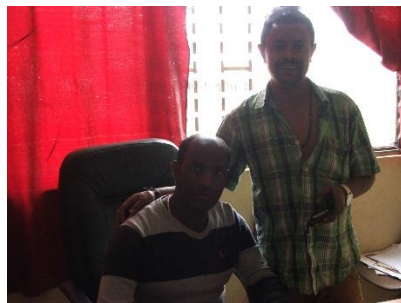
adm. medewerker sebeta school